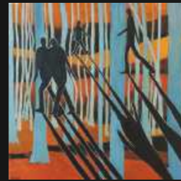
16. Forêt intérieure 100 x 100