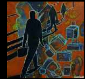
47. A chacun ses valises 30 x 30