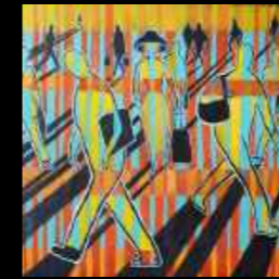
25. À chacun son écossais 100 x 100