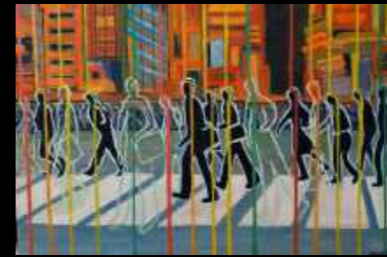
26. Connexions 12 x 80