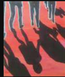
3. Passants du soir 46 x 38