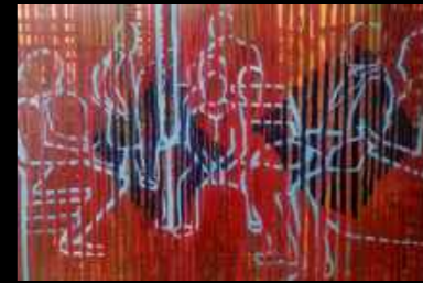
28. Tranche de vie 120 x 80