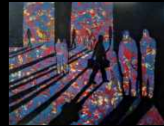
29. Phosphorescence 116 x 89