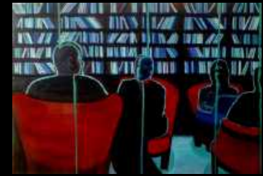
35. Les coulisses 130 x 89