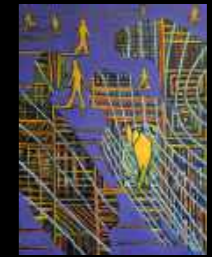
40. Où va le monde ? 70 x 100