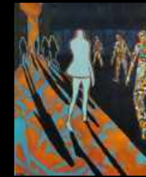
39. Où va-t-on ? 70 x 100