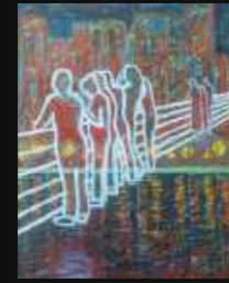
8. Spectateurs 60 x 80