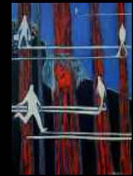
30. Liens 70 x 100