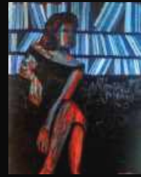
7. La reine de Dumas 60 x 80