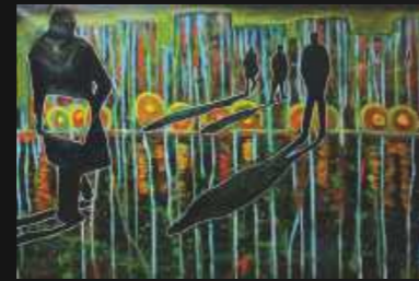
4. Sur le chemin 100 x 70