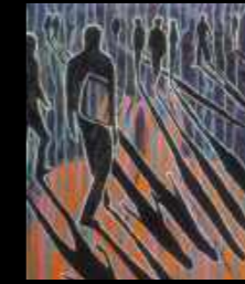
33. Éternels passants 50 x 61