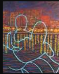
20. Au coucher du soleil 81 x 100