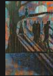
18. Spleen repetita 70 x 100