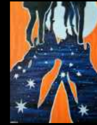
31. Ce qui fait la nuit en nous... 70 x 100