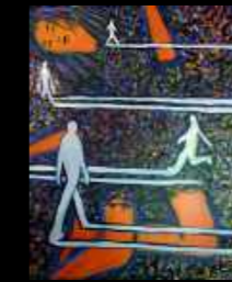
44. Evanescence 33 x 41