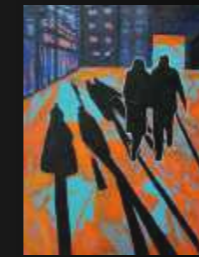
24. Issue 54 x 73