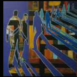
12. Transcender 100 x 100