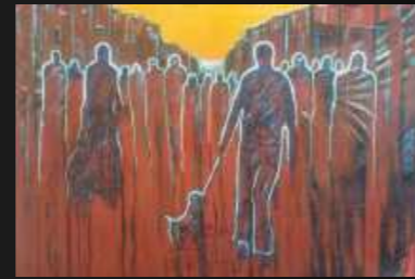
5. Solitude 100 x 70