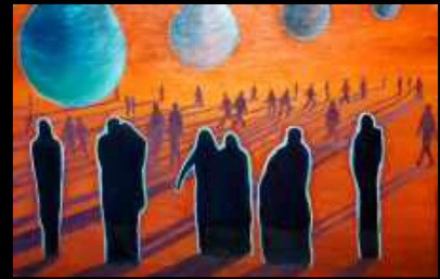
41. À chacun ses planètes 100 x 65