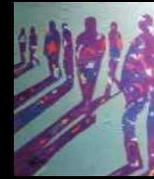
34. Particules moléculaires 63 x 70