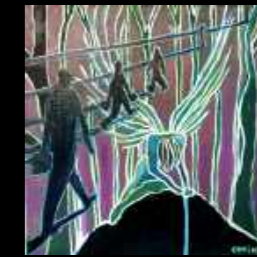
46. Pesanteur 30 x 30