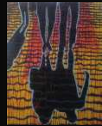
2. Entre les filets 60 x 80