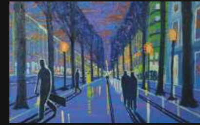
9. Miroir urbain 91 x 60