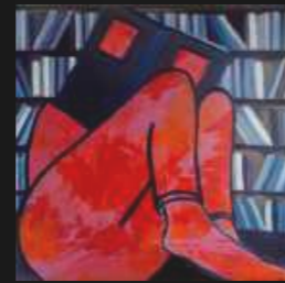
17. Intensément 100 x 100