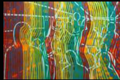
19. Vibrations 120 x 80