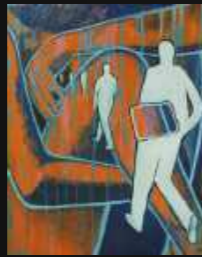
15. Eternellement 70 x 100