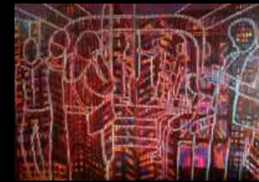
42. Subway 89 x 116