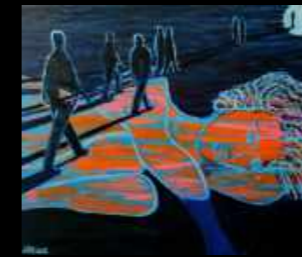
43. Vagues à l'âme 61 x 50