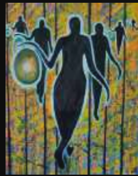
14. Les passeurs 73 x 92