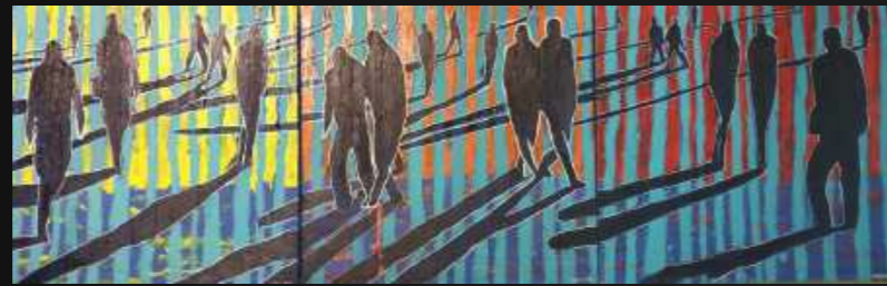
21. 22. 23. Cheminement 60 x 60 (x3)