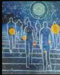
13. Au-delà 50 x 70