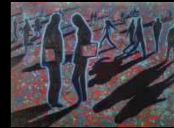
38. Fluorescence 116 x 89