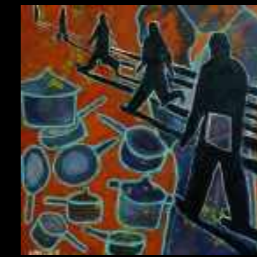
45. A chacun ses casseroles 30 x 30