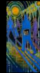
27. Espace temps 40 x 80