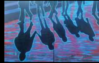
32. Sous la pluie Dptyque 2x 89 x 116