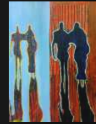
11. Mirage 50 x 70