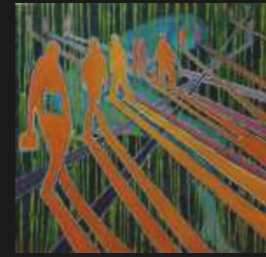
10. Diagonales du fou 80 x 80