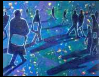
6. Transitions 100 x 81