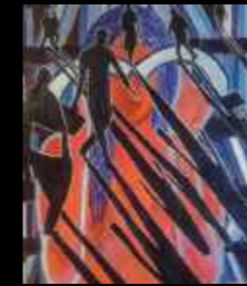
36. À livre ouvert 81 x 100