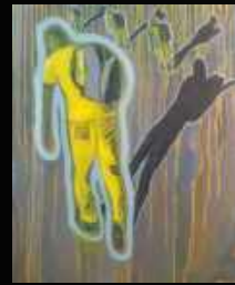
1. Pesanteur 60 x 80